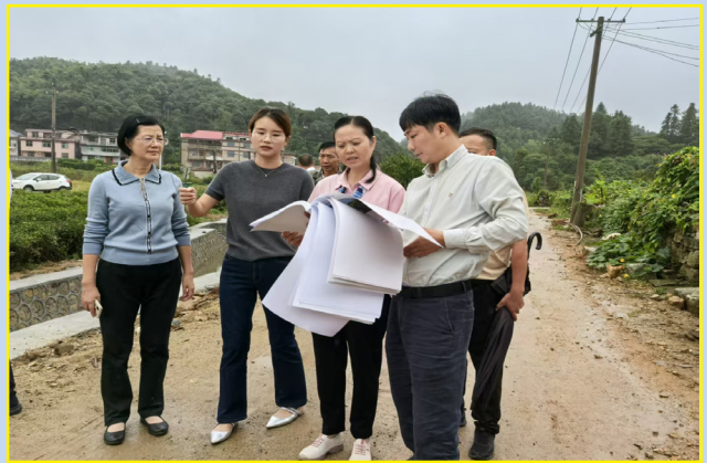
9月26日，市政协副主席、民进市委主委蓝文在兴国县齐分村调研乡村振兴工作。