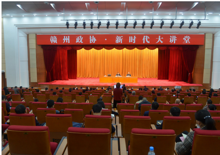
2022年3月7日，“赣州政协·新时代大讲堂”首期正式开讲。

多层制度化发展的要求，抓住了全面发展协商民主的本质和要旨。我们要把习近平总书记的重要讲话精神落实到政协各项履职工作中，不断提高政协协商制度化、规范化、程序化水平。近年来，赣州市政协大力实施以政协党的建设、政治协商、民主监督、参政议政、凝聚共识、机关建设为主要内容的“六大提升行动”，着力打造了“赣事好商量·委员市长面对面”协商品牌，建立了党政领导荐题领题、全周期深度协商、领衔督办重点提案、批示协商成果等一系列工作机制。新征程上，我们将聚焦政协专门协商机构建设，不断健全深度协商互动、意见充分表达、广泛凝聚共识的机制，完善协商工作规则，推动全过程人民民主更广泛、更真实、更管用，为凝心凝力谱写中国式现代化江西篇章作出新的更大贡献。