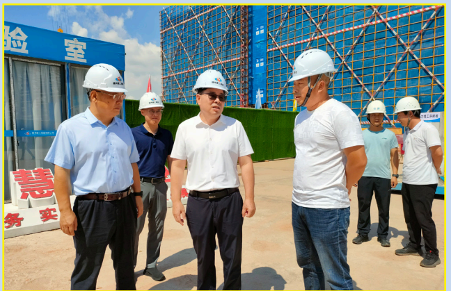
9月29日，市政协副主席、民革市委主委蓝贇在大余县梅国小学建设项目工地督导安全生产工作。